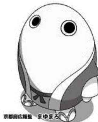
京都府広報 まゆまろ

家庭・青少年支援課 ひとり親・ヤングケアラー支援係 TEL 075-414-4585