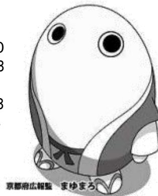
京都府広報監 まゆまろ